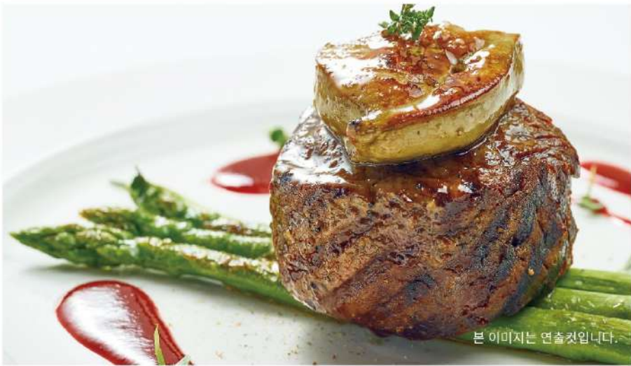
본 이미지는 연출컷입니다.